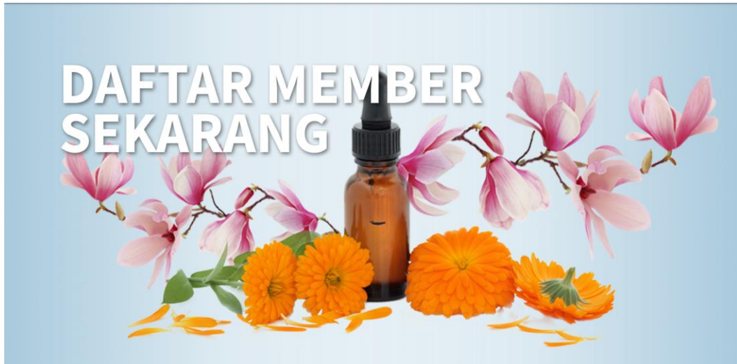
Gambar 2. Judul Gambar

Semua gambar, tabel, dll harus memiliki keterangan, pusat dibenarkan dalam 11 pt Times New Roman. Keterangan mendahului table tetapi mengikuti angka. Tabel dan gambar harus muncul sedekat mungkin dengan titik acuan mereka sebagai pemformatan yang memuaskan dari izin dokumen final.